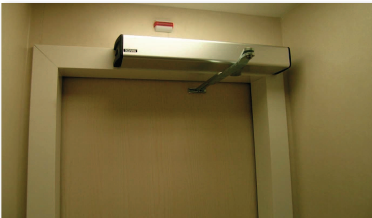
Puerta peatonal batiente de una hoja