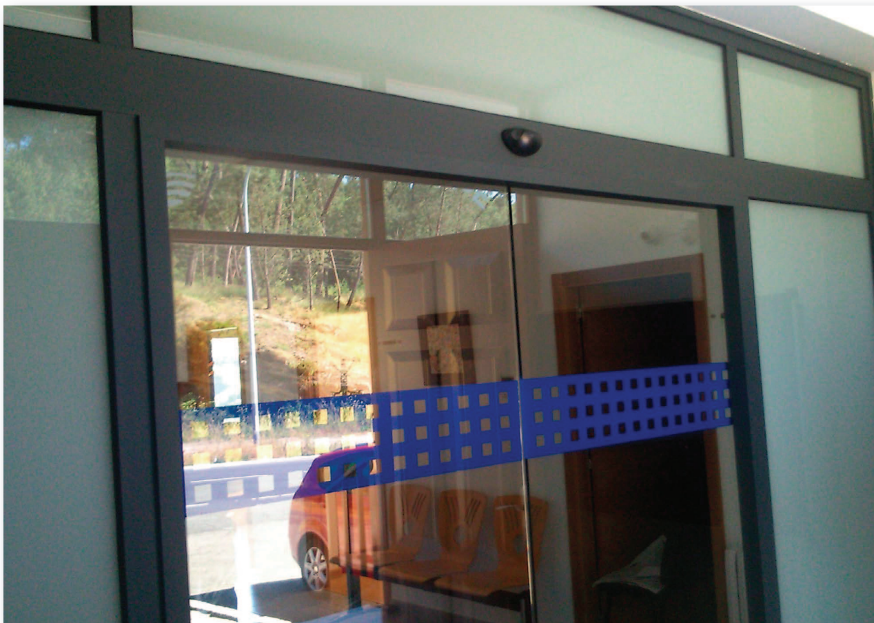
Puerta peatonal corredera de doble hoja sin marco y estructura con hojas fijas y dintel en vidrio ácido. Sistema de apertura mediante radar microondas.